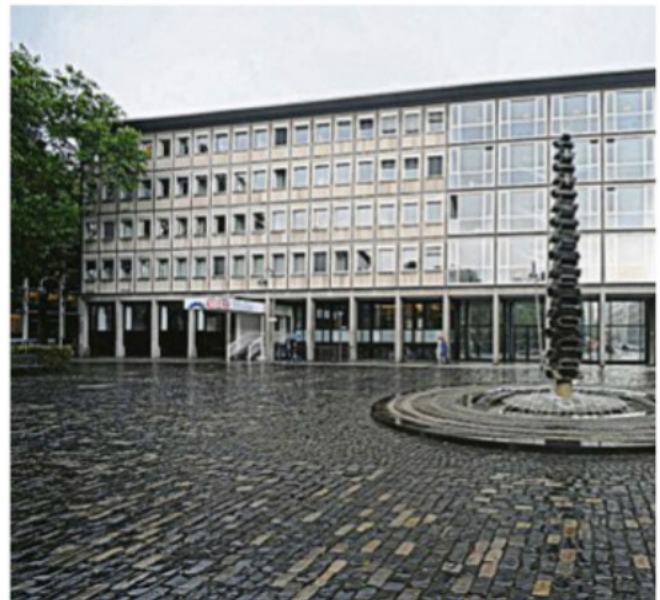
Das Kammergebäude in der Innenstadt

Insgesamt 26 Plätze, also knapp ein Drittel der Sitze, konnte „New Kammer“ holen. Beobachter sehen darin einen Achtungserfolg, der von einigen befürchtete Erdrutsch blieb aber aus. In einem ersten Schritt wer-